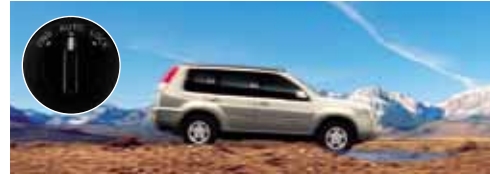
الدفع الرباعي المتغير لجميع الأوضاع All mode 4X4