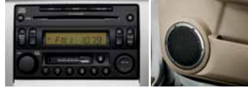
نظام ترفيه صوتي متميز مع مبدل لستة أقراص مدججة Impressive audio system with in-dash 6-CD changer