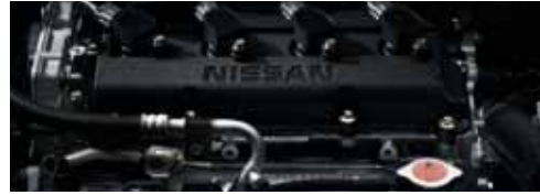
محرك ٢.٥ لتر، ٤ اسطوانات، ١٨٠ حصاناً 2.5 litre, 180 hp, 4 cylinder engine