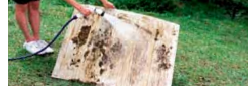
لوح الأمتعة القابل للغسل Washable luggage board