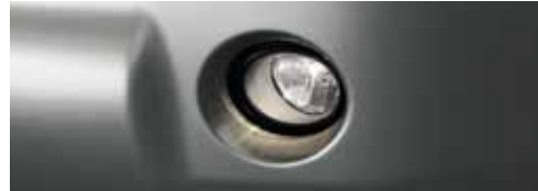
كشافات ضباب (اختياري) Fog lamps (opt)