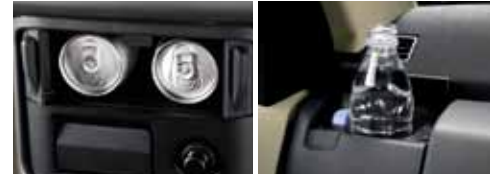
صندوق مشروبات مبتكر، وحاملان للأكواب مع مبرد Innovative drink boxes and 2 front cupholders (with cooler)