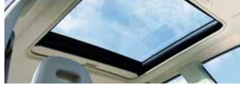
فتحة سقف أكبر Extra large sunroof