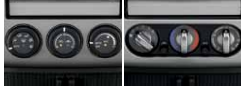
مكيف هواء أوتوماتيكي Auto air conditioning